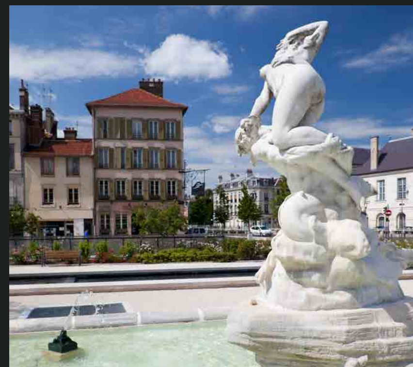
Fontaine, place de la Libération