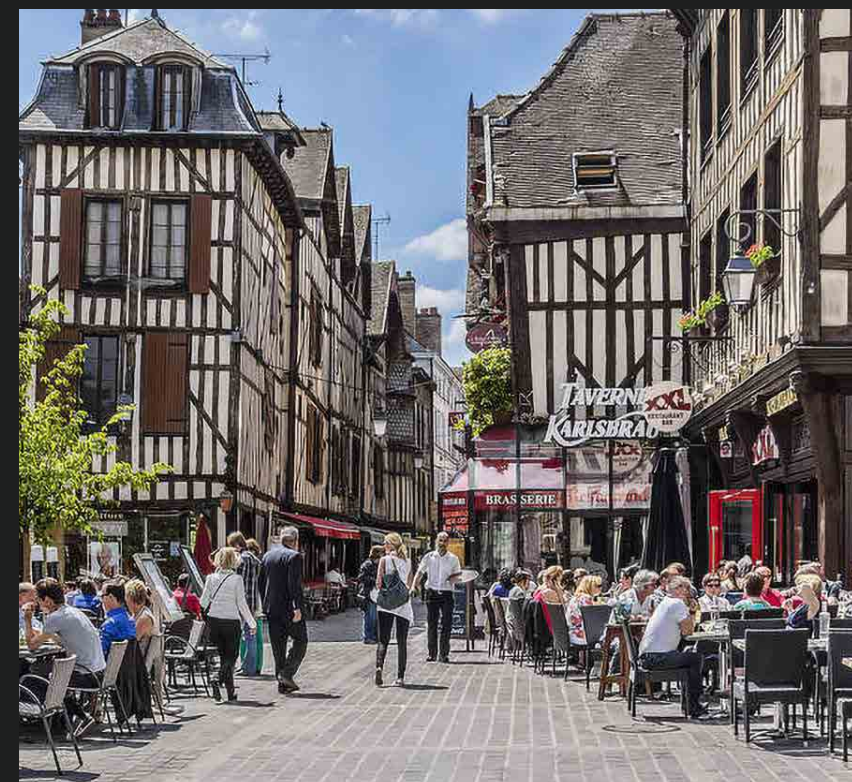
Place Alexandre Israël

Troyes ne compte pas moins de 10 églises, 6 musées,